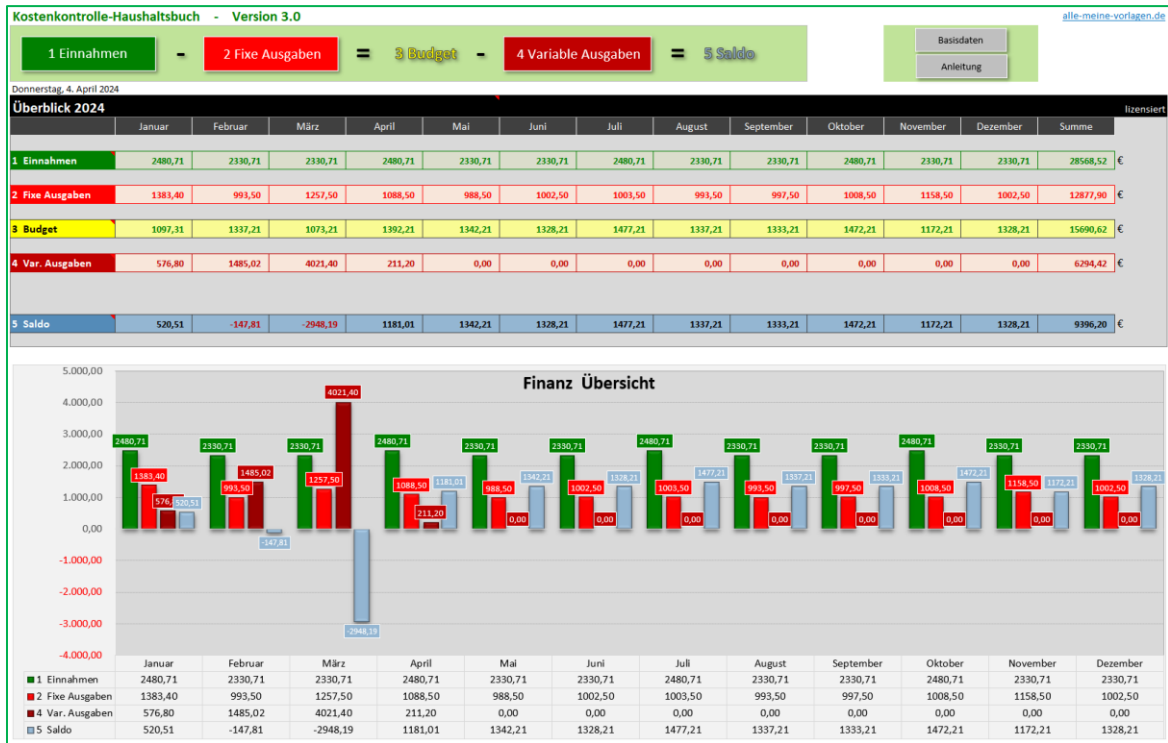
Abbildung 1 - Überblick

Der Hauptbildschirm bzw. das Dashboard von Kostenkontrolle Haushaltsbuch ist die Seite «Überblick»: